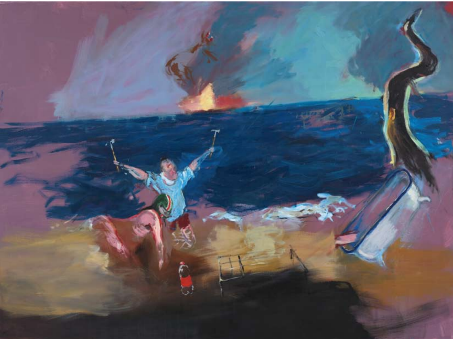
Gestrane scheepstimmerlui met grille en badkuip olieverf op doek, 2021 140 x 190 cm

Steevast ironiseert Van Erp de gebeurtenissen met titels als Voorlaatste Man op de Strandbarbecue en Medisch Personeel op de Gehaktballenplantage . 'Ik geef het vorm, maar begrip brengt het me niet. Mocht ik het ooit begrijpen, dan houdt het misschien op.' [Kees Verbeek]