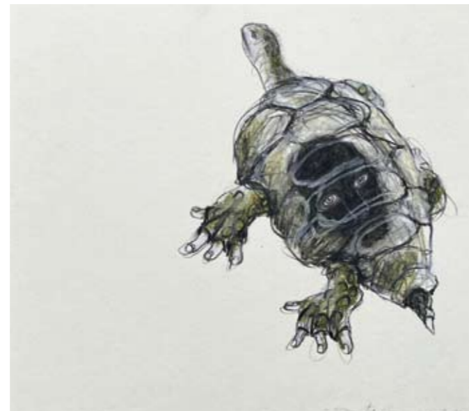
Collectors Editions (selectie) werk op papier, 2024 22 x 24 cm