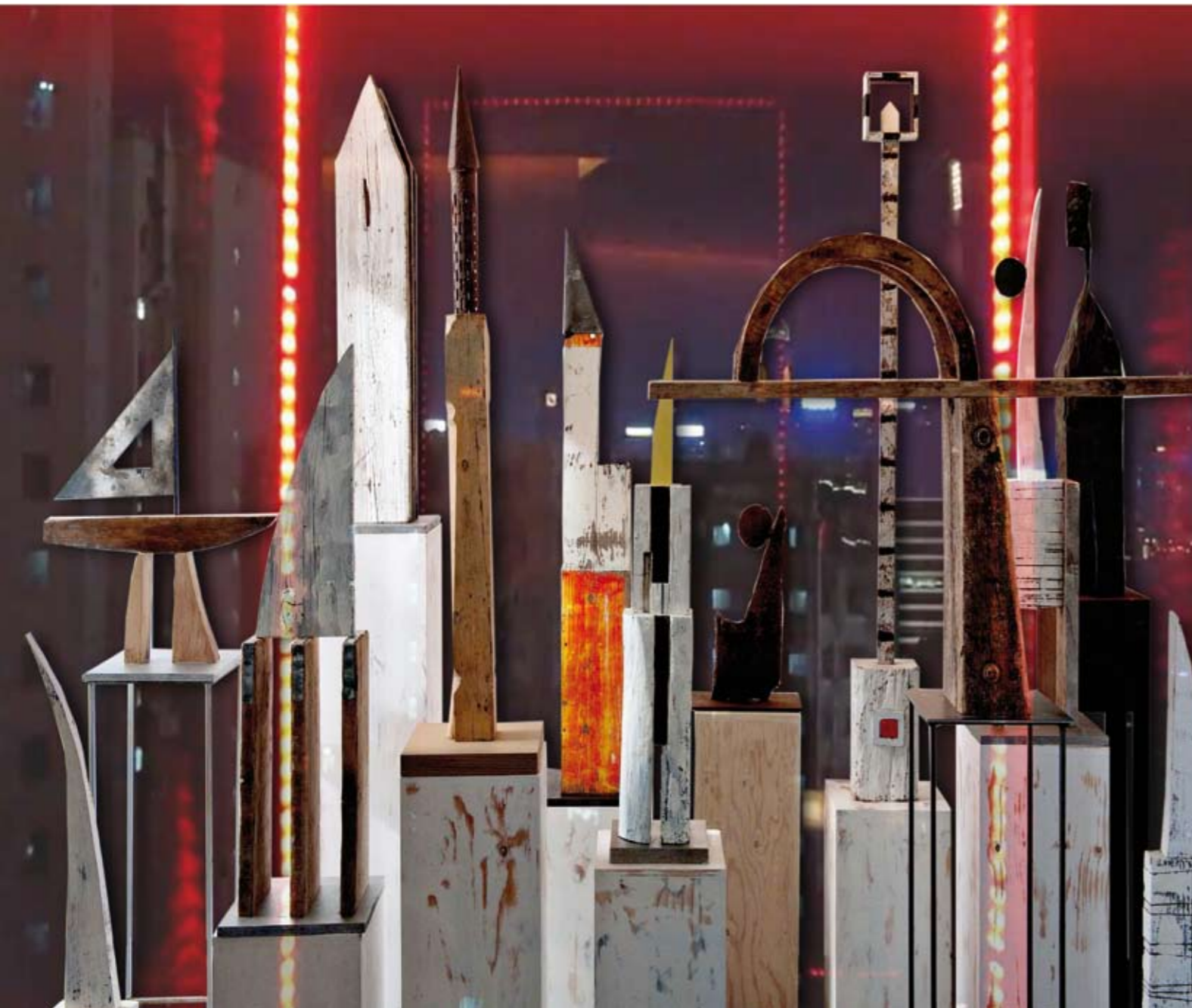
Installation Museum Het Valkhof, Nijmegen, 2011